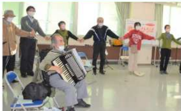
友の会の人気企画「歌ごえひろば」がまつりに登場！ アコーディオンの音色に合わせてみんなで歌いましょう